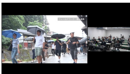
フィールドワークの映像紹介