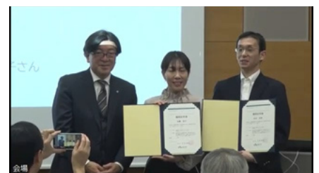
終了証授与の様子